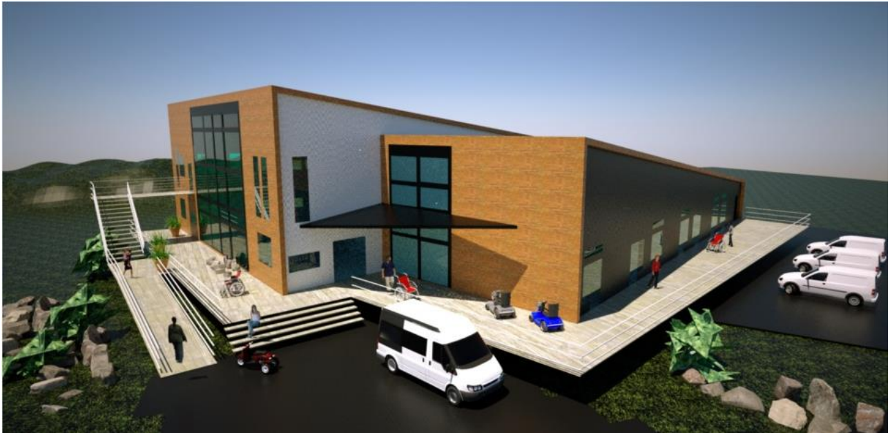
Nuna tamakkerlugu innarluutilinnut sullissivissaq Sisimiuniissaaq Nalunnguarfimmu isikkiveqassalluni.

siunnersuisarnerup ilitsersuisarnerullu qulakkeerneqarnissaa kiisalu kommuninut, inuussutissarsiutigalugu suliaqartunut kiisalu qanigisaasunut innarluutilinnut suliaassaqrifiup iluani pikkorissaasarnissaaq aammalu sammisaqartarnissaaq. Nuna tamakkerlugu innarluutilinnut sullissivik 2017-imi ammarneqassaaq.