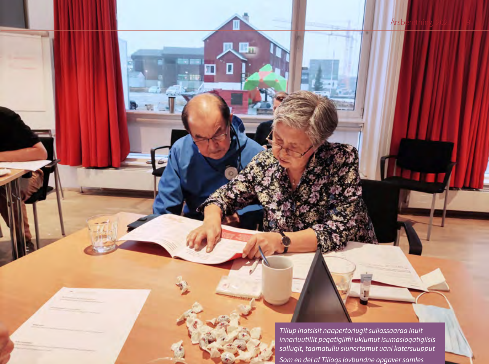
Tiliup inatsisit naapertorlugit suliassaaraa inuit innarluutillit peqatigiiffii ukiumut isumasioqatigiisis-sallugit, taamatullu siunertamut uani katersuupput Som en del af Tilioqs lovbundne opgaver samles handicapforeningerne en gang om året til et seminar.

Inuit innarluutillit illersuisuata suliassai pingaarnerit tassaap-put: