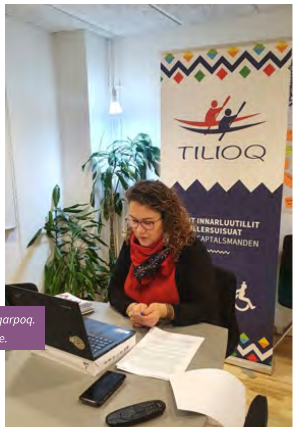
Tiliup sulineranut soqutiginnittoqarpoq. Der er interesse for Tilioqs arbejde.

Kampagnen satte også fokus på status for implementeringen af handicap-loven, et år efter, at den trådte i kraft. Tilioq kontaktede samtlige kommuner for at høre, hvordan sagsbehandlingen fungerer med den nye lov. Her blev det særligt fremhævet, at loven mangler en vejledning, og at kun få kommuner har etableret bisidder, dannet handicap-råd eller lavet en ny handicap-politik.