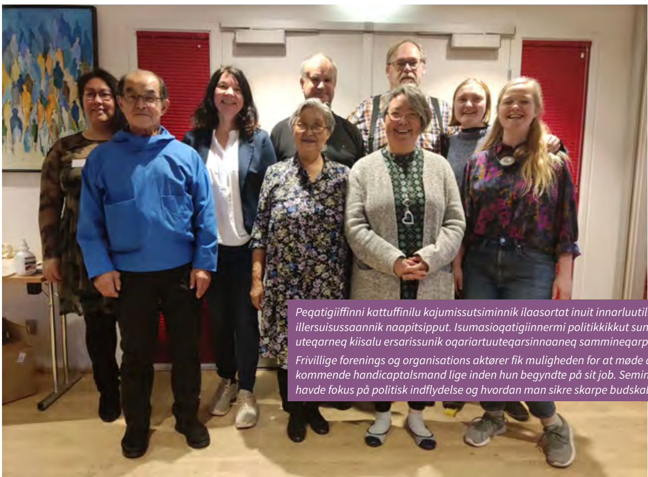
Peqatigiiffinni kattuffinilu kajumissutsiminnik ilaasortat inuit innarluutillit illersuisussaannik naapitsipput. Isumasioqatigiinnermi politikikkut sunni-uteqarneq kiisalu ersarissunik oqariartuuteqarsinnaaneq sammineqarput. Frivillige forenings og organisations aktører fik muligheden for at møde den kommende handicaptalsmand lige inden hun begyndte på sit job. Seminaret havde fokus på politisk indflydelse og hvordan man sikre skarpe budskaber.

Tilioq’s seminar for foreninger og organisatio-ner blev atter igen påvirket af covid-19 restrikti-oner, der op til d. 26. og 27. november krævede tilpasninger og omstillingsparathed for at kun-