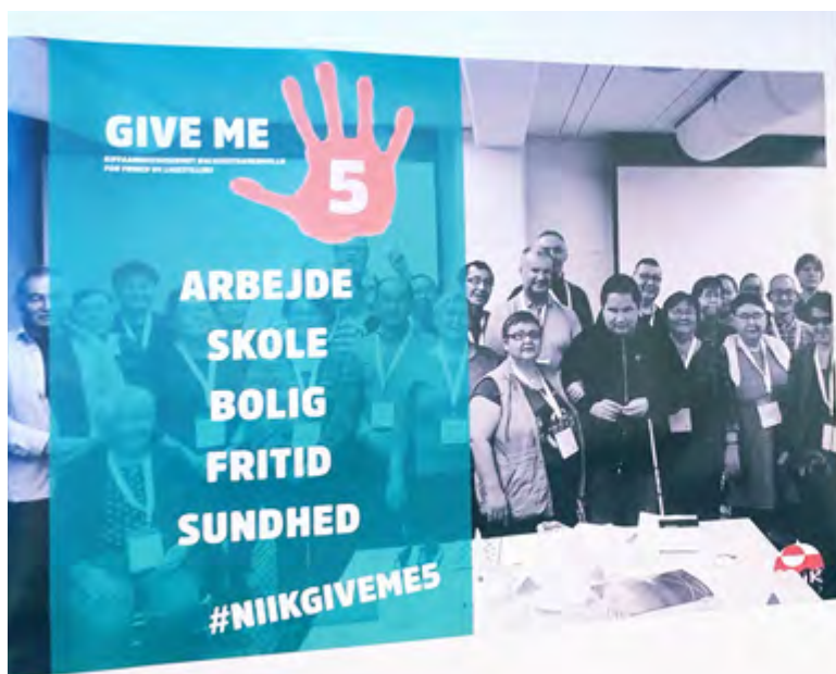
Kommunalvalgskampagne #NIIKGiveMe5 Kommunalbestyrelsesmøt qinersineq #NIIKGiveMe5

Tilioq ser altid personen først og ser personer med handicap som hele mennesker. Hele befolkningen skal anse personer med handicap som ligeværdige borgere, der har rettigheder på lige fod med alle andre. Personer med handicap skal ses som den ressource i samfundet, de er, og personer med handicap skal se sig selv som ressourcefulde, ligeværdige medborgere. Tilioq bruger sin platform til at bearbejde samfundet til at have denne holdning til personer med handicap. Ydermere vil Tilioq arbejde for, at der er let tilgængelig viden om handicap og handicap-relaterede emner.