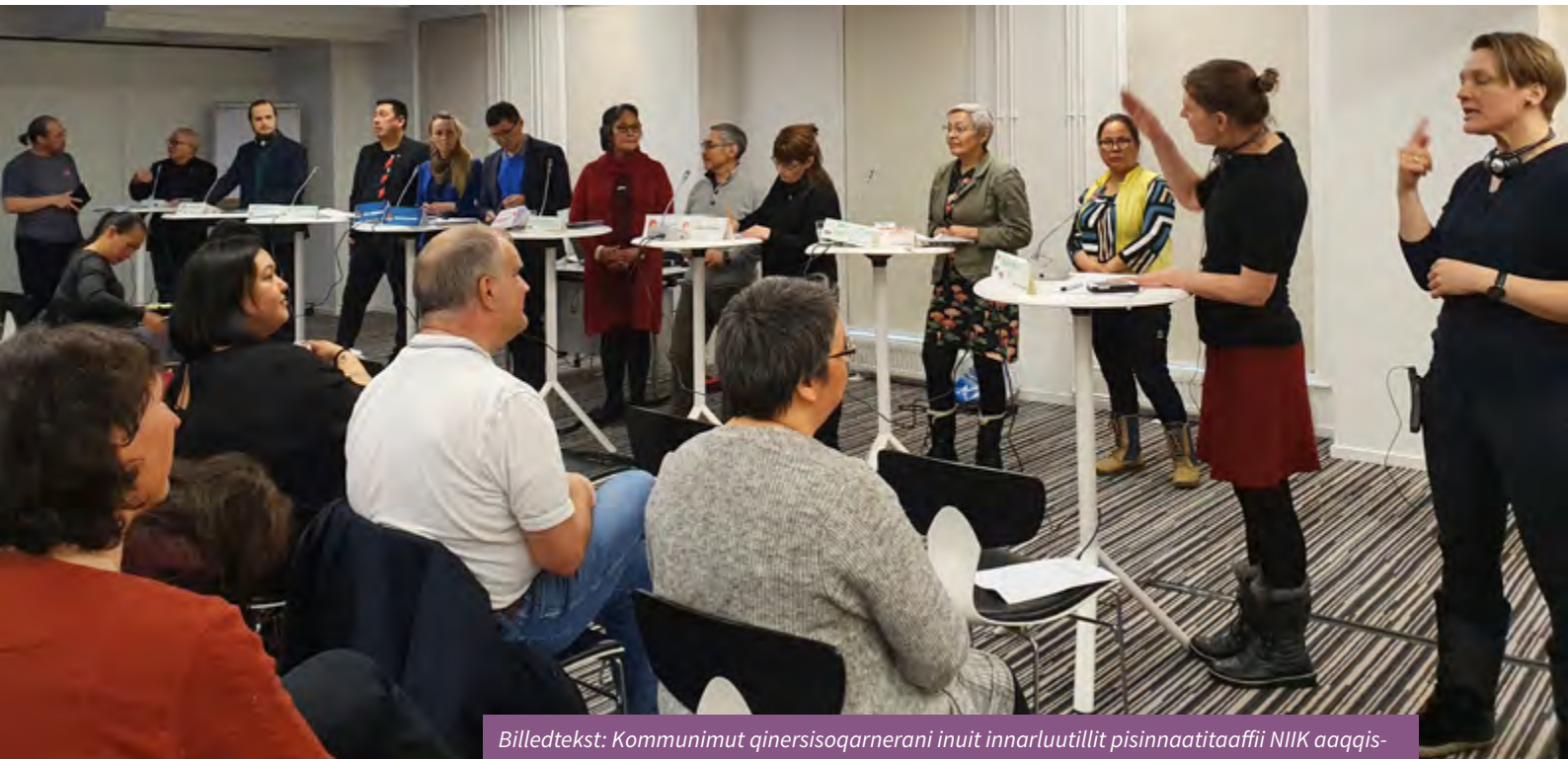
Billedtekst: Kommunimut qinersisoqarnerani inuit innarluutillit pisinnaatitaaffii NIIK aqqis-suisoqaralugu sammineqarput, paasisitsiniaaneq ima ilisarnaateqarluni #NIIKGIVEMES kommunalvalgsdebat med fokus på rettigheder for personer med handicap arrangeret af NIIK i forbindelse med #NIIKGIVEMES kampagnen.

usissiani, iliuusissatullu pilersaarutini nutaani arbejdsgruppini, siunnersuisoqatigiinni tusarniaanerni suliaqarnenilu peqa-taalluartaq, taamaalillunilu inuit innarluutillit iliuusissani tamani ilanngunneqartarnissaanut Tilioq suliaqarpoq.