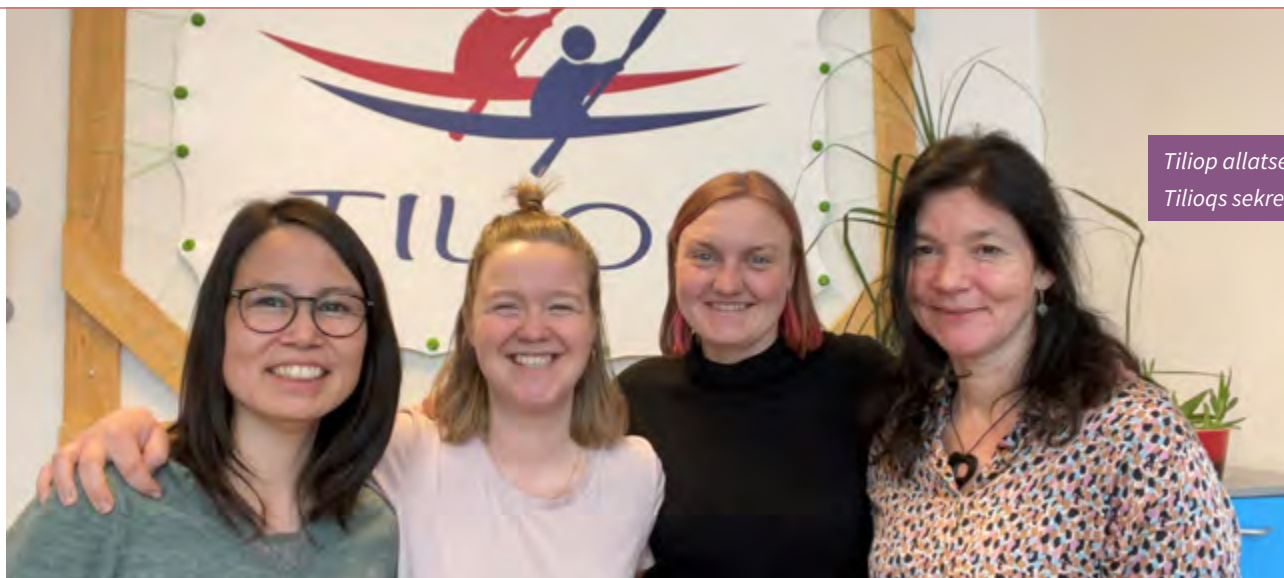
Tiliq allatseqarfia Tiliqs sekretariat