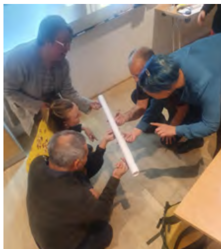
Tilioq inuit innarluutilit kattuffiilu suleqatigiinnissamik isumasioqatigiinnermi eqqartuipput, misileraallutik

Projektet er startet i 2021 og forventes afsluttet i 2023.