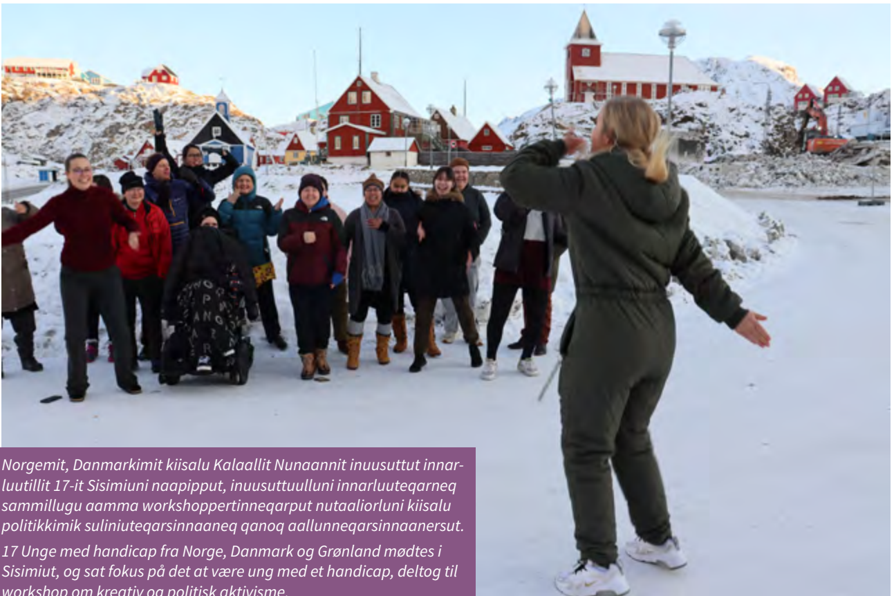
Norgemít, Danmarkimít kiisalu Kalaallit Nunaannit inuusuttut innarluutillit 17-it Sisimiuni naapípput, inuusuttuulluni innarluuteqarneq sammillugu aamma workshopertinneqarput nutaaliarluni kiisalu politikimik suliniuteqarsinnaaneq qanoq aallunneqarsinnaanersut. 17 Unge med handicap fra Norge, Danmark og Grønland mødtes i Sisimiut, og sat fokus på det at være ung med et handicap, deltog til workshop om kreativ og politisk aktivisme.

identificere handicap-politiske emner, som er relevante for deres arbejde samt hjælpe dem til at handle på disse. Hvis foreninger, organisationer og lignende ønsker viden om handicap eller hvordan man kan arbejde med inklusion i sin forening, stiller Tilioq sin viden til rådighed. Tilioq har derfor også et tæt samarbejde med handicap-foreningerne. Dette samarbejde udviklede sig i 2021 til, at Tilioq var med til at facilitere to kapacitetsopbyggende workshops for ISI's nyvalgte bestyrelse.